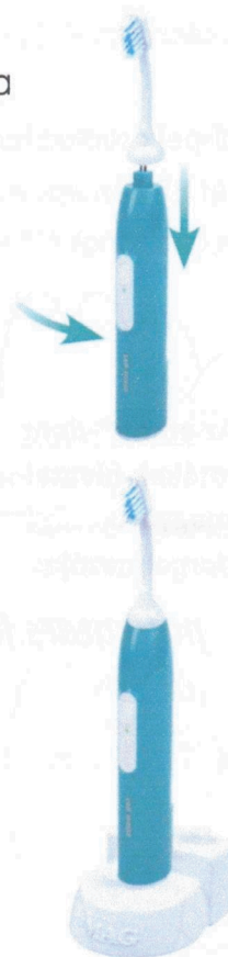
Töltés közben mindig csatlakoztassa az UH kiegészítőt a készülékhez, a kézi egység állapotának jobb ellenőrzése érdekében.